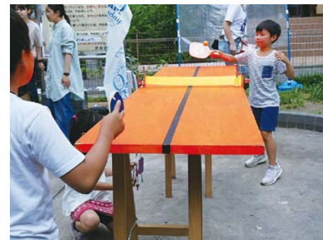
熱戦を繰り広げる子どもたち。