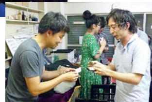
会終了後は名刺交換タイムも!