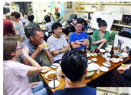
神二商和会の役員、デザイン事務所社員、神二在住の人など、さまざまな人が一つのテーブルを囲む