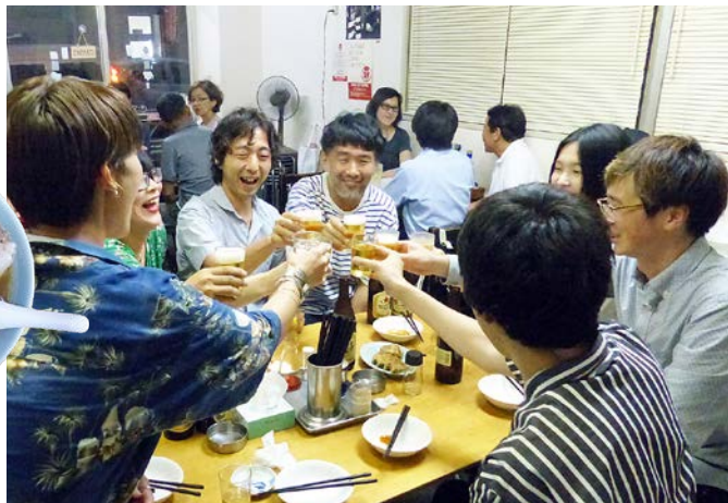
初対面の人もあり合いの人、仲良く一緒に「かんぱーい」!

賑やかな会から一夜明けて、商店街を歩いていると、会の参加者と偶然出会い「きのうは楽しかった」と声をかけてもらった。「当日出会った参加者の人と、メールで“文通”が続