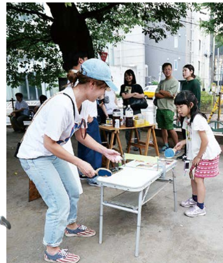
大人も子どもも卓球に挑戦。奥には地域密着型のコミュニティラジオ「渋谷のラジオ」取材班の姿も。

このイベントを企画したバウムでは、月に一度、「BAR UM (バー・ウム)」という飲み会とトークショーの間をコンセプトにしたイベントも開催しているそう。お酒を酌み交わしつつ、個性豊かなゲストならではの話を聞けるイベントだ。こんな場へ出かければ、お隣さんとの交流がさらに広がるかも？