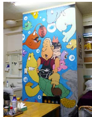
店内には女将さん、旦那さんの壁画が。常連さんの筆によるもので、地元の人に親しまれている時田屋らしい