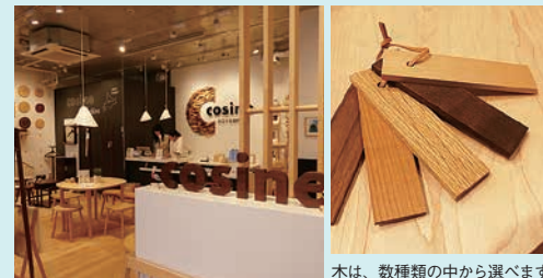
木は、数種類の中から選べます

北海道・旭川に工房を持つ「コサイン」の初めての直営店で、2014年10月にオープン。コースターから椅子や机まで、小物も大きめの生活道具もあり、木を大切に使いきる工夫をしながら作られています。