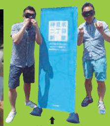
この看板が目印です!